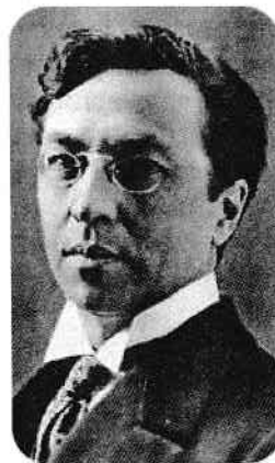
Renumitul pictor Wassily Wassilyevich Kandinsky

Cu toate că interpretarea culorilor cunoaște ușoare variații în funcție de aria culturală, ele au fost folosite ca suport al gândirii simbolice din timpuri imemoriale.